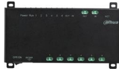
DHI-VTNS1006A-2 大華 VTNS1006A-2 控制器