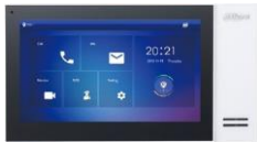
DHI-VTH2421FW-P 大華 7 吋觸碰式 IP 室內機