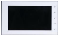
DHI-VTH5222CH-S1 大華 IP 影視對講機